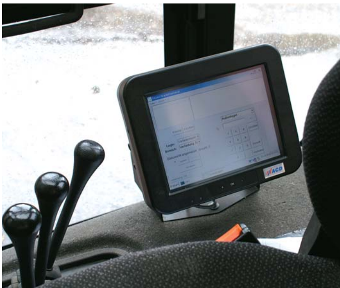
Neben KVH, Duo-Balken und BSH aus Hochregallagern werden per Terminal im Stapler Bauholz-, Latten- und Schalungs-Pakete ...

„Zwischenzeitlich ist der Wunsch, alle Abläufe durch TimberTec-Software zu verwalten, steuern und optimieren auf 130% angewachsen“, beschreibt Schneider den langen Weg zur Berücksichtigung aller Details einer kommissionsweisen Fertigung – bei der bekanntlich alle Stücke anders sein dürfen. CS