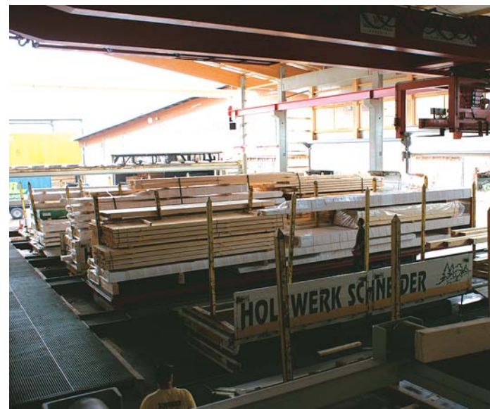
... vom Außenlager angefordert und per Fremdaufgabe den sechs halbautomatischen Verladeboxen zur Verfügung gestellt