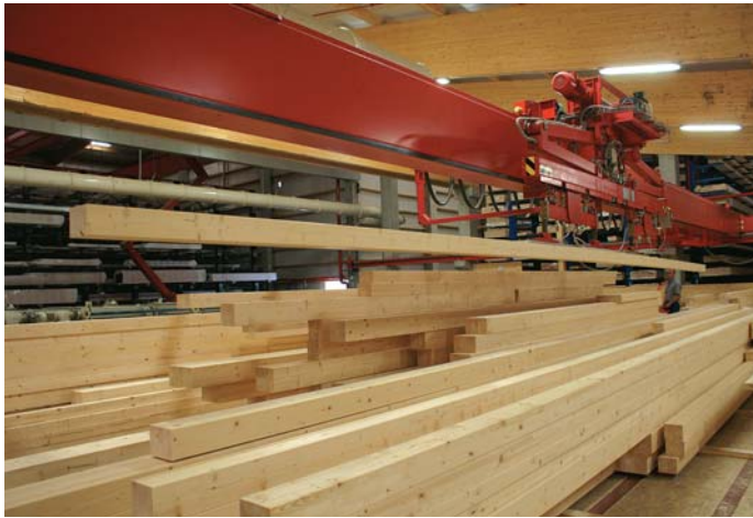
Kommissionierung nach den vier Final-Hobelmaschinen per Kran, im Hintergrund die beiden Hochregallager

Grafische Verladeplanung. Täglich verlassen rund 20 Lkw das Werksgelände in Eberhardzell. Durchschnittlich weist eine Tour fünf bis sieben Abladestellen auf. Die beiden Disponenten legen fest, welcher Auftrag mit welcher Lkw-Fahrt ausgeliefert wird. Dies erfolgt durch eine grafische Verladeplanung. Dabei werden die Aufträge ähnlicher Auslieferungszeit und regionaler Bestimmung aufgerufen.