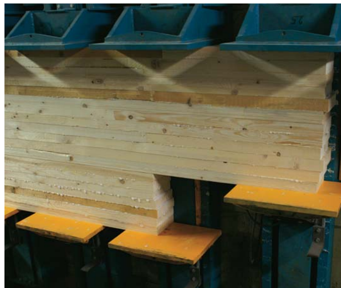
Anhand der optimierten Längen erfolgt die oft treppenartige Belegung der Presse