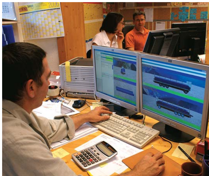
Grafisches Verladen der optimierten Pakete per Drag & Drop samt Tourenplanung für 20 Lkw pro Tag mit fünf bis sieben Abladestellen

Vor den Pressen sind drei Linien mit SMB -Keilzinken ausgerüstet, die Mechanisierung liefert HIT , Ettringen/DE.