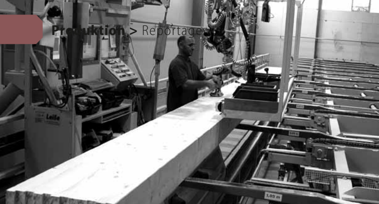
Grafik: TimberTec